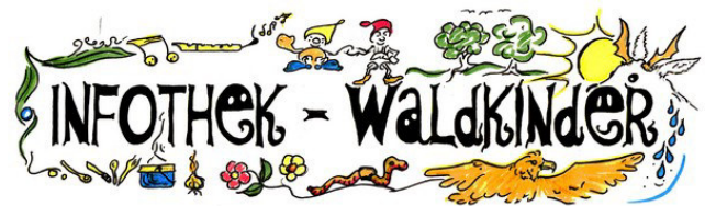
Logo Infothek Waldkinder