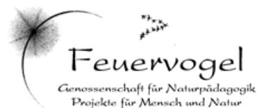
Logo Feuervogel Genossenschaft