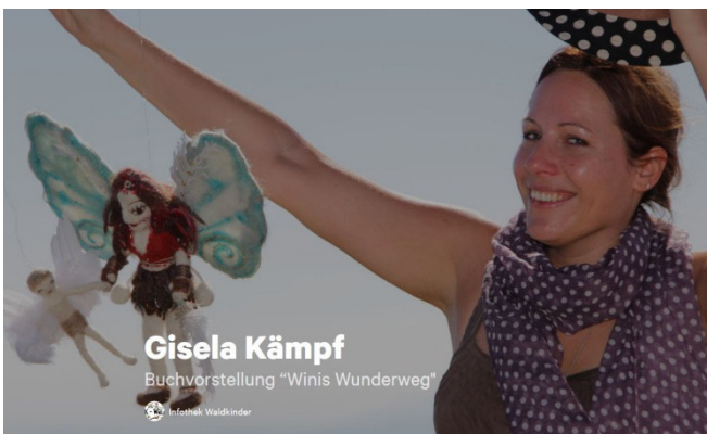
Deckblatt des Video Interviews